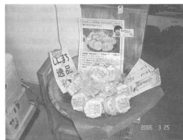
逸品のディスプレイ