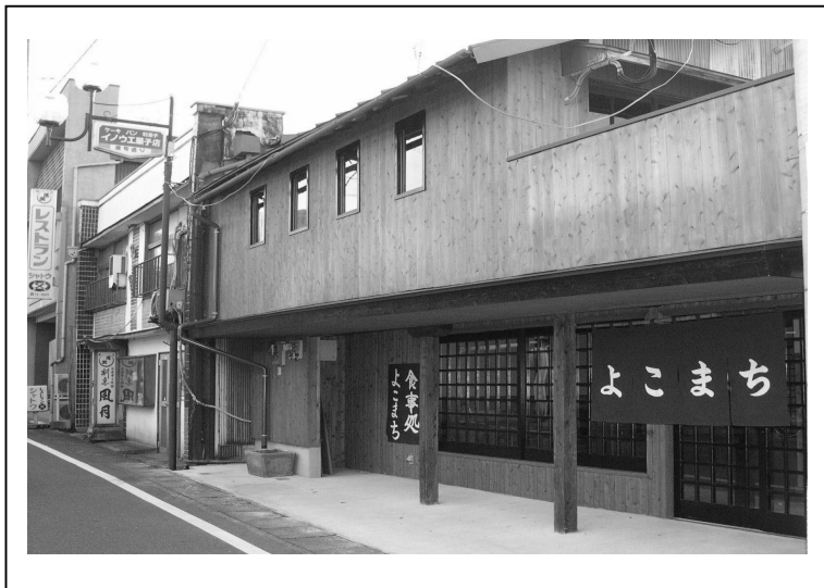
「よこまち」外観（右）