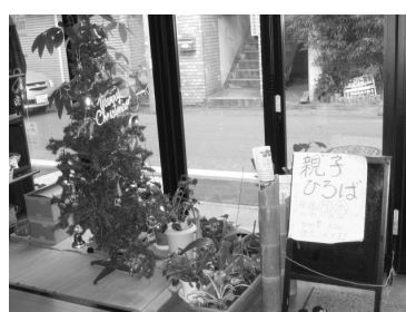
「遊友ひろば」内部の様子