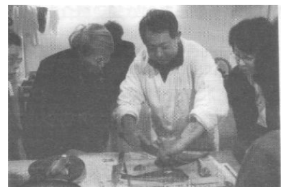
商店主による専門知識講座

商店街内の鮮魚店「魚幸」店主を講師として「魚の見分け方・捌き方」などの専門知識講座を行い、魚介をメインとしたパーティ料理を楽しむ「海の幸でクリスマス」を開催した。（参加者 18 名）