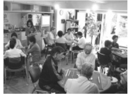
健康麻雀教室の様子

毎月第一第三水曜日に主に高齢者を対象として、施設の厨房設備で一緒に食事を作りコミュニケーションを図る昼食会を開催した。(実施日数 13 日、参加者 115 名)