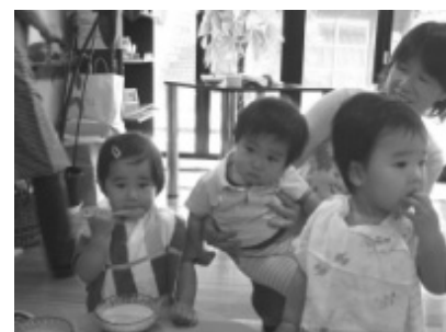
「親子で素食」の様子