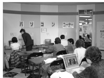
パソコン教室の様子

商業者のパソコン利用が促進することを目指し、TMO所有の中古パソコンを使用したパソコン教室を開催した。1コース2日間で2コース実施し、計4日間で71名が受講した。