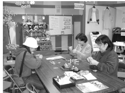
小物作り体験教室の様子