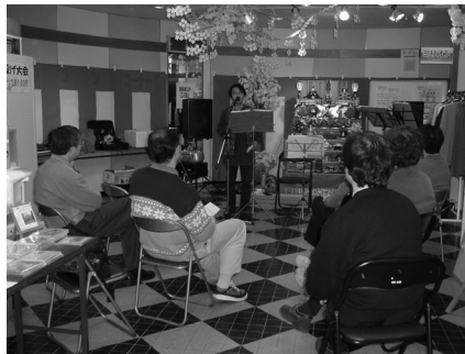
ひなまつりコンサートの様子