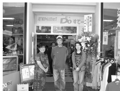
「D o すてーじ」外観