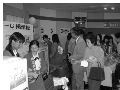
高校生の販売実習の様子

地元商業高校の生徒による販売実習である「球磨っ子ハウス」を開催した。3年生の選択授業の一環であり、生徒が店長と店員を務め、仕入れから販売まで担当した。実践的に小売業を体験することにより、生徒の職業観を育てることが狙いである。10月以降、基本的に毎週金曜日午後2時から開催した。