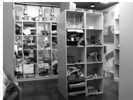
「フリマパレット いらっしゃ〜い館」の様子