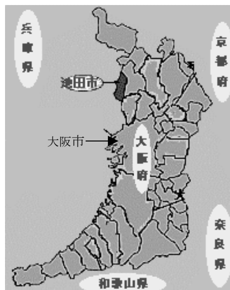
池田市の位置（池田市のHPより）

池田市では中心市街地活性化を目指しており、市が策定した「池田市中心市街地活性化基本計画」を基に、池田商工会議所が中心となって「池田市TMO構想」を策定した。その後、推進事業者であるいけだサンシー株式会社が平成15年3月にTMOとして認定された。TMO構想で提示された事業メニューのうち、緊急性・重要性の高い「空き