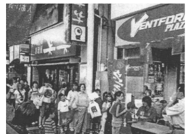
「まちなかヴァンフォーレプラザ」外観