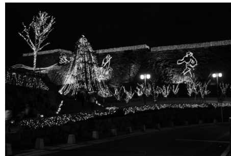
光のピュシスの様子