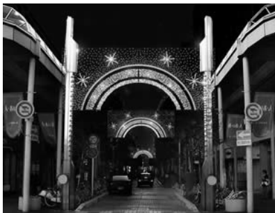
ナイトジュエリーの様子

「ナイトジュエリー」や「光のピュシス」を広く県内外に発信するため、専用ホームページを作成し甲府商工会議所ホームページのトップページに掲載した。