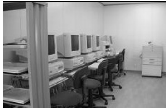
「こーるかん」の様子