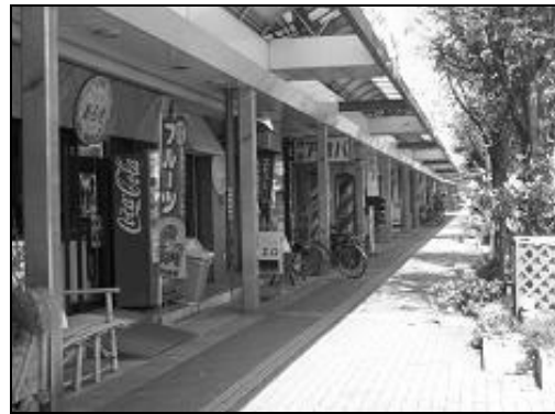
築町商店街の様子

地域通貨「コール」を活用した本事業を実施することによって、商店街に商業機能だけでなく、福祉や教育などの機能を充実させ、市民交流や地域コミュニティを育み、厚みのあるまちづくりを推進するとともに、商店街と市民との関わりを深めていくことで、いつまでも愛される商店街として、繁栄し続けていくことを目的とした。