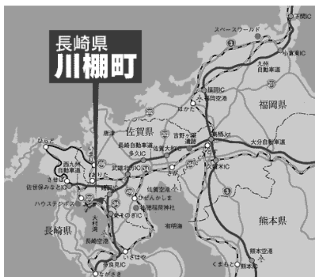
川棚町位置図