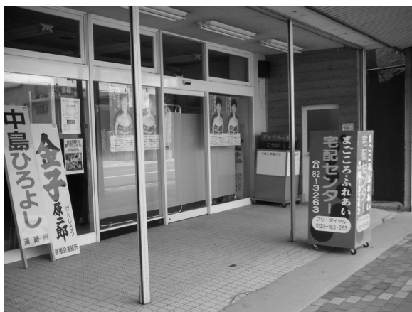
宅配センター外観