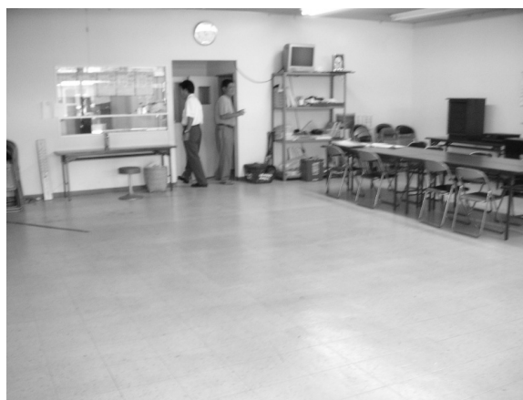
宅配センター内部