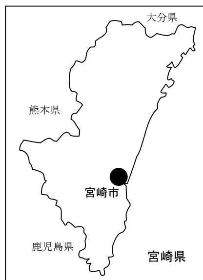
宮崎市の位置 （宮崎市役所HPより）

そのため宮崎商工会議所では、平成12年度「チャレンジショップ事業」、平成13年度「まちなか情報拠点整備事業（空き店舗を利用した情報拠点の整備）」、平成14年度「まちなかプレイパーク事業（NPO法人等と連携した子どもが学んで遊べる拠点づ