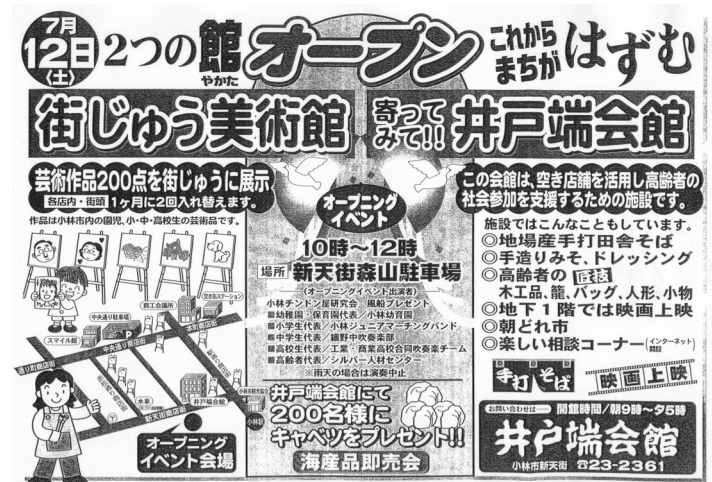
井戸端会館のオープンチラシ

(2) 運営体制 小林商工会議所内に、商店街関係者、小・中・高等学校等関係者、シルバー人材センター、行政機関関係者からなる小林市商店街いきいき活性化推進委員会内に「寄ってみて井戸端会館の部」を設置し、事業の企画・運営を行った。