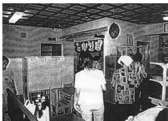
田舎そば麺コーナー

・事業経費 使用する食器、調味料、鍋、割り箸等は、同センターの予算や会員所有の不要物を活用した。