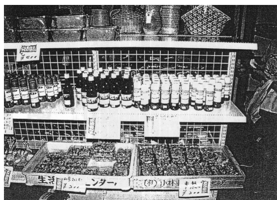
高齢者の創作作品展示販売コーナー

自分の技(匠)を生かした高齢者の創作活動は、籠やバッグ、人形など小物をはじめその分野は広い。この高齢者の創作作品を展示販売することにより、高齢者の生き甲斐づくりやコミュニティビジネスへのチャレンジ精神の滋養を図った。