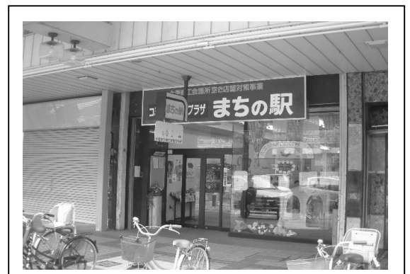
大垣市子育て交流プラザ