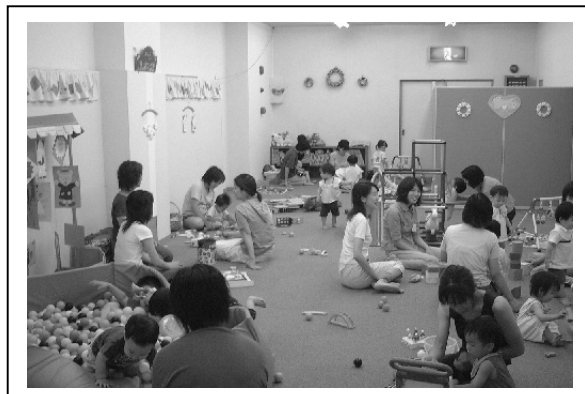
子育て交流プラザ

これまで中心商店街になかった「子育て支援」という新たな機能を付加したことにより、子育て中の若い世代が市内各地から（一部市外からも）集うようになり、僅かではあるが賑わいづくりに効果があった。また、子育て中の若い母親の子育てに関する不安解消に役立った。