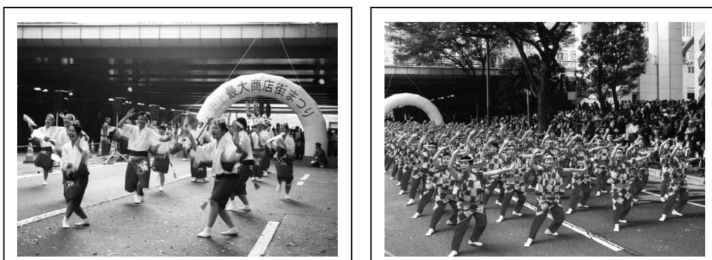
大江戸パレードの様子

ふれあい通りの総勢 1,000 名の大江戸パレードが行われ、参加した商店街は各地域の華やかな踊りなどを披露した。