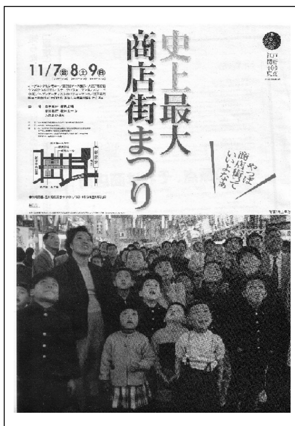
「史上最大商店街まつり」のチラシ