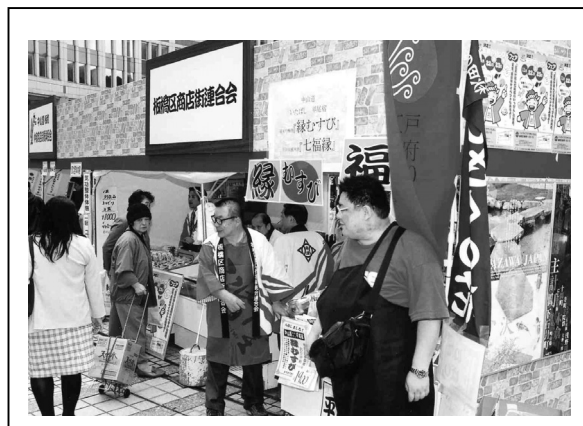
「板橋区商店街連合会」のブースの様子

上野商店街連合会(台東区)・都振連、アニメと杉並(杉並区)、早稲田の商店街(新宿区)、町田市商店会連合会(町田市)、仲宿商店街振興組合(板橋区)、板橋区商店街連合会(板橋区)、ニュー北町商店街振興組合(練馬区)、傳通院前通り三盛会(文京区)、あだちふれあい旬感プラザ(足立区)