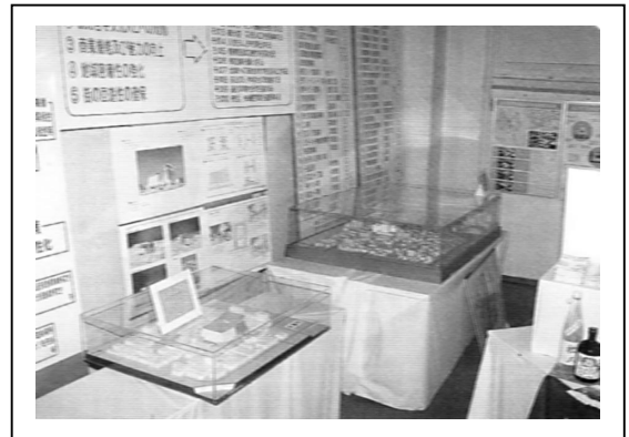
まちづくり展示コーナー

補助金を活用しての事業の場合、交付決定日以降の事業開始という決まりがあり、決定前の活動の制限と決定後の短期間での事業実施という、難しい問題が発生する。