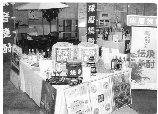
■物産・観光展示コーナー（球磨焼酎コーナー）