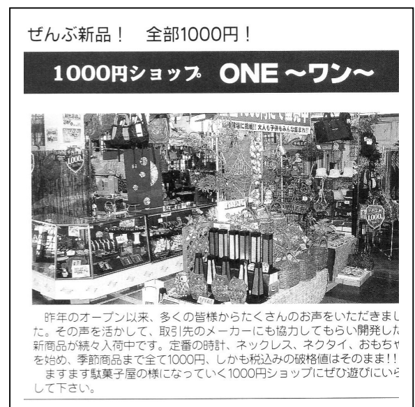
チャレンジショップ 「ONE(ワン)」