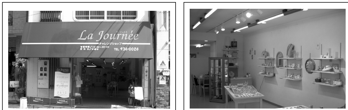
チャレンジショップ「ラ・ジュールネ」正面（左）と店内（右）