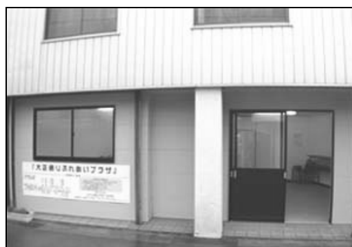
「大正通りふれあいプラザ」の外観