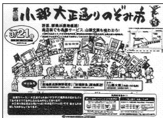
「大正通りのぞみ市」案内チラシ