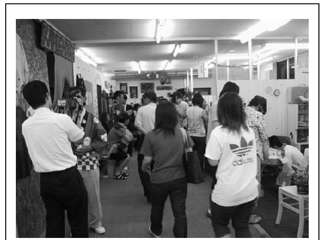
チャレンジショップ ドルレーグの全景（左）と内部（右）