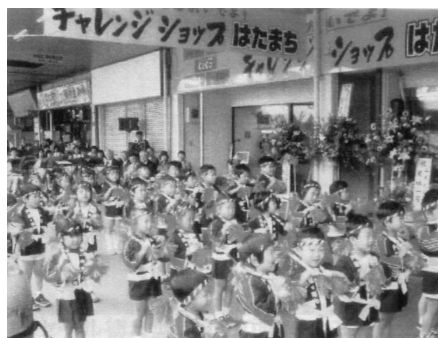
チャレンジショップオープニングイベント