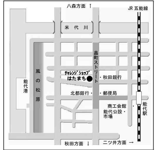
チャレンジショップ位置図