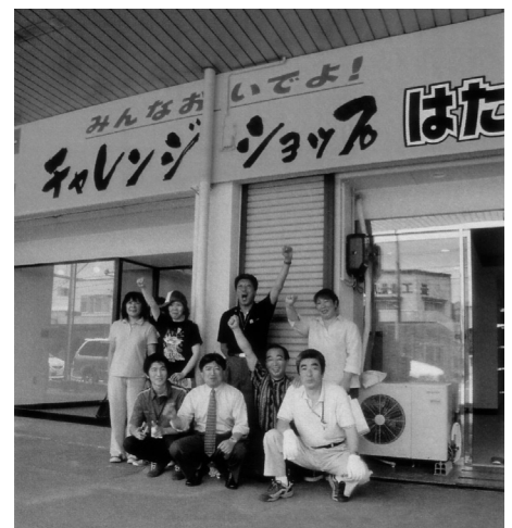
チャレンジショップ出店者

出店には、開業意欲のある人や意欲ある経営者で新たに商売を始めたいとする、衣料品「カメゾウ亀三」、中国小物「TenTen」、手作り雑貨「CoCo」、山野草「山草工房」、自然食品マッサージ・アロマセラピーサロン「トウ・リラージュ」、農産産直「ポケットファーム」、喫茶「白神コーヒー」の7店のほか、地元能代商業高校生徒の販売実習店舗のお菓子・ファンシー小物「能商直営店あきんどう」が出店。