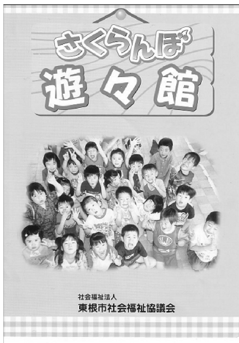
「さくらんぼ遊々館」のパンフ

東根市商工会 http://www.shokokai-yamagata.or.jp/higashine/