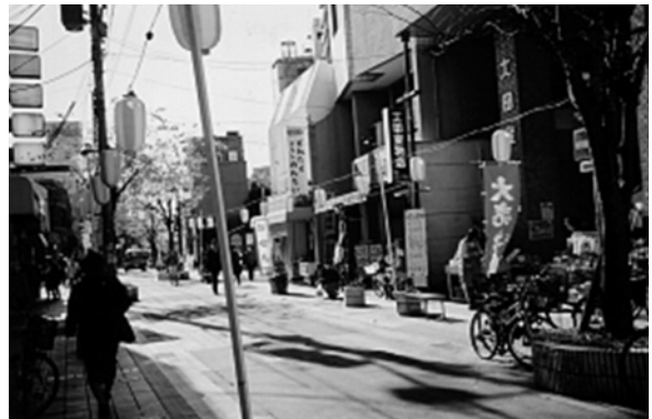
二日市中央通り商店街の様子