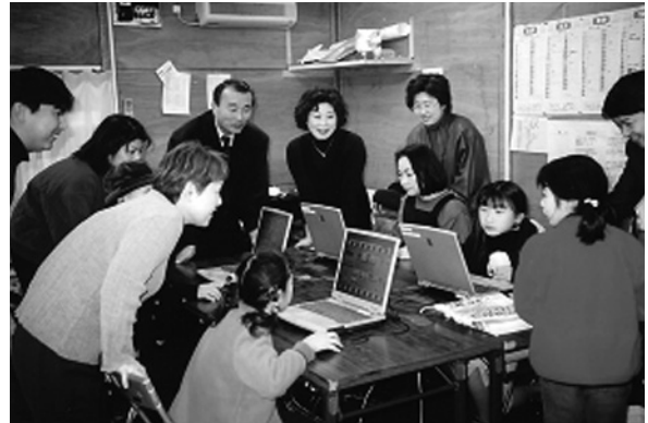
インターネット体験コーナー