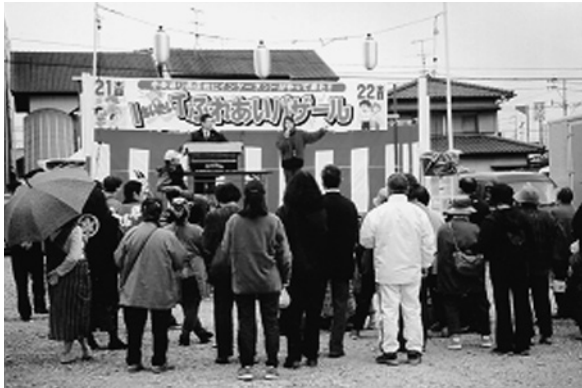
特設会場イベントの様子