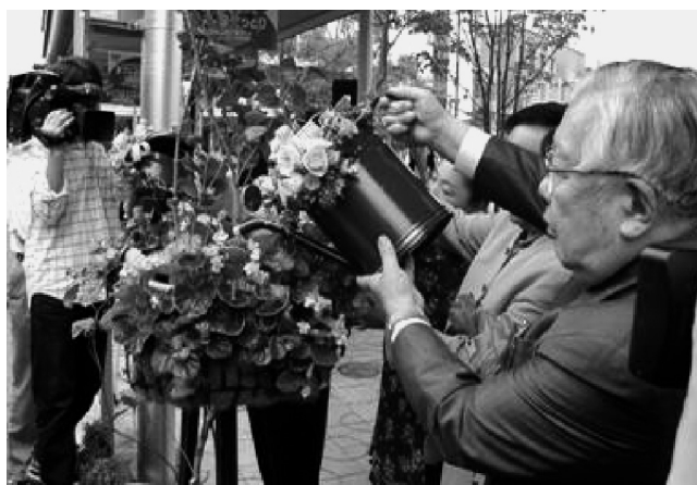
ハンギングバスケット設置の様子