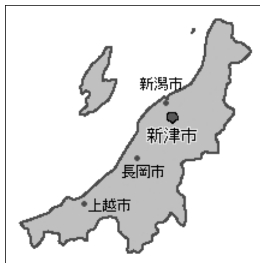
新津市の位置（新津市HPより）

そこで当連合会は、新津市が推進する環境施策のもと、エコロジーを題材として空き缶やペットボトルのリサイクルという誰しものが参加しやすい形態の美化運動を通じ、根本的な美化とまちづくりへの市民参加の接点としてネットワークの構築とそのキーステーションとしてエコステー