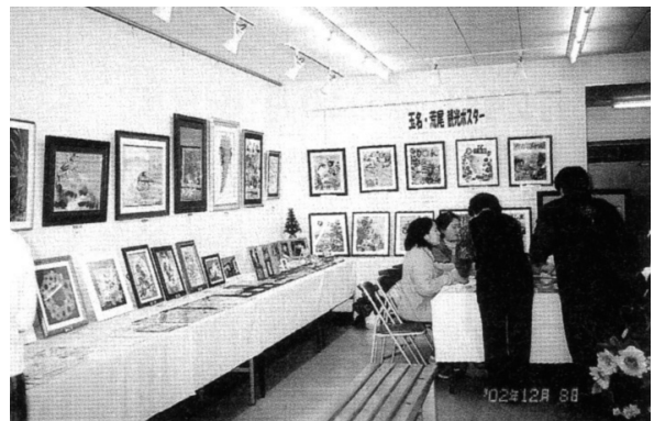
ミニギャラリー～パンの花作品展（左）と押し花二人展（右）