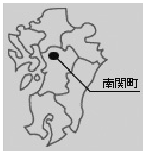
玉名郡南関町の位置

南関町では、平成11年度策定した南関町中心市街地活性化基本計画にもとづき、12年以降、商工会においてTMO等が実施すべき事業等について、研究を行ってきた。そして、その事業構想の事業の1つに「空き店舗対策事業」を掲げ、平成14年度実施することとなった。