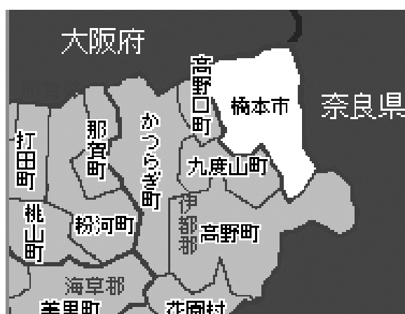
橋本市の位置

平成10年度には中心市街地活性化法に基づく「橋本市中心市街地活性化基本計画」がまとめられ、平成11年度に橋本商工会議所が「中心市街地活性化タウンマネジメント構想策定に関する報告書」をまとめ、TMOの設立に向けコンセンサス形成に努めてきた。