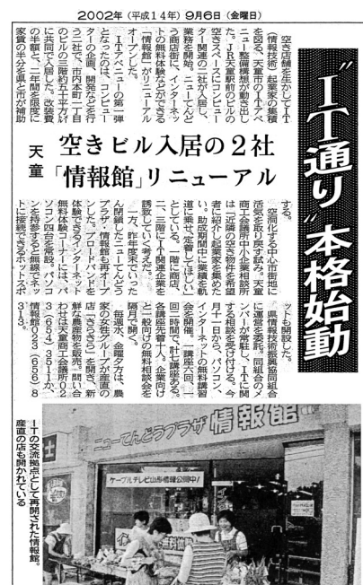
新聞記事（山形新聞 2002.9.6）