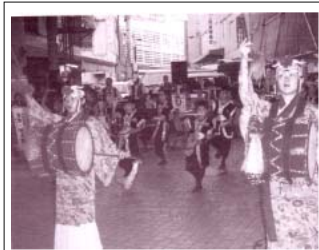
イベント： 鼓衆 若太陽 参加者約 300 名