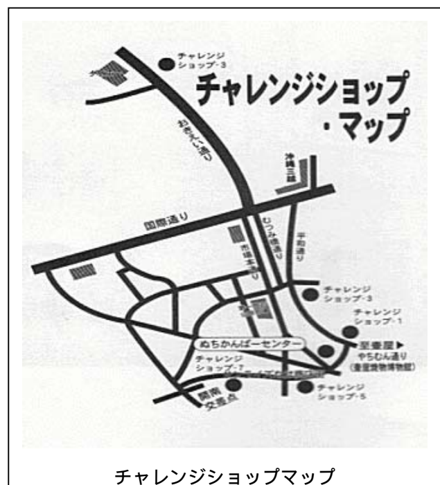
チャレンジショップマップ

当初の予定募集店舗数は 10 店舗であったが、それを大幅に上回る 76 件の応募があった。5 つの空き店舗に 16 名の方々に提供（チャレンジショップ 1 ; 67 坪・9 名、チャレンジショップ 2 ; 32 坪・3 名、チャレンジショップ 3 ; 31.8 坪・2 名、チャレンジショップ 5 ; 16 坪・1 名、チャレンジショップ 7 ; 7.4 坪・1 名）し、家賃は全額補助。1 店舗は、商工会議所のインフォメー