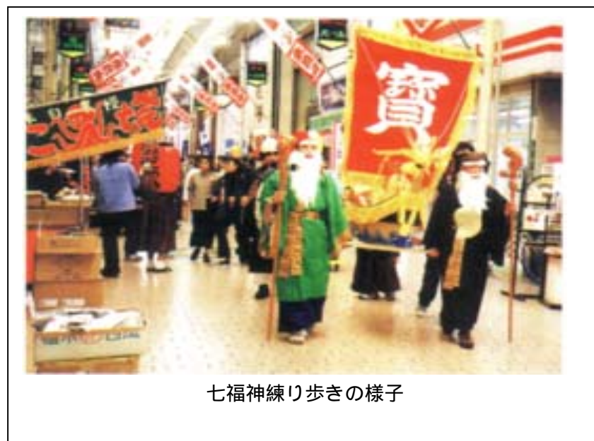
七福神練り歩きの様子