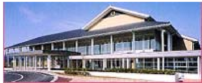
コミュニティ・センター

現在、中心市街地には町民広場、コミュニティ・センター(スポーツアリーナ)、曳山展示会館の3カ所に駐車場が立地しているが、パーク・アンド・ライドによる周遊バスの利用を促進させるため、中心市街地商業等活性化基本計画に基づき、上新町に1ヶ所、別荘地区に1ヶ所の駐車場の新設を計画している。また、駐車場への誘導サインも併せて整備を進めている。