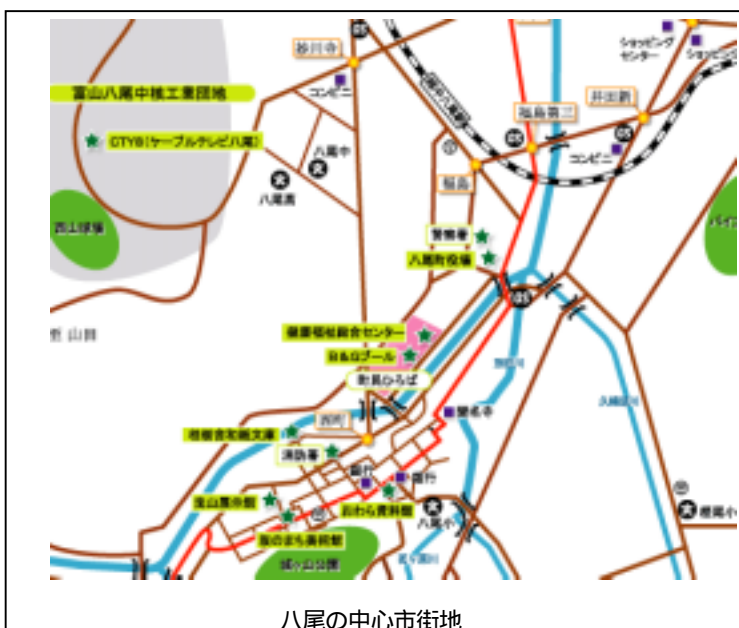
八尾の中心市街地

これに対処すべく平成10年度に八尾町中心市街地活性化基本計画とTMO構想が策定され、平成11年3月には商工会がTMOとして認定された。