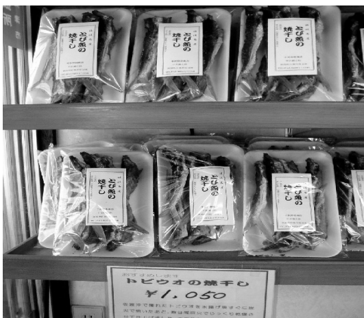
▲佐渡産・天日干しの飛び魚の焼干し