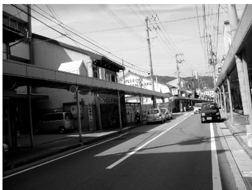
▲両津夷本町商店街の様子

店舗は両津夷本町商店街の中程に位置する。佐渡の土産として水産加工品を購入する観光客が多いが、同店は両津港ターミナルから徒歩約 10 分の距離にあり、観光スポットへの通り道でもないことから立地的に決して良いとはいえない。