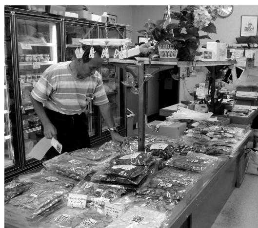
▲佐渡産の乾燥ワカメと珍味