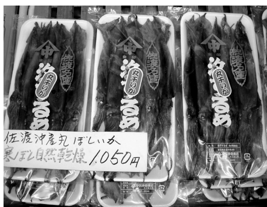
▲佐渡産・天日干しの干しイカと丸干しイカ