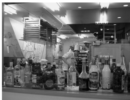
▲店内から製造現場がガラス越しによく見える