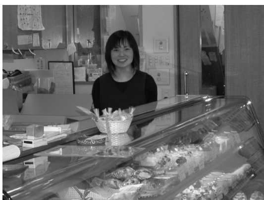
▲笑顔の販売員さん

それだけでなく、商品づくりにも好影響を与える。顧客の好みや意見を職人が直接聞くことができることから、次の商品開発のヒントを得ることができる。また、商品の販売状況の確認もできるので種類別製造計画に役立つ。さらに、顧客から常に見られていることから、良い緊張感をもって製造に当たることができる。