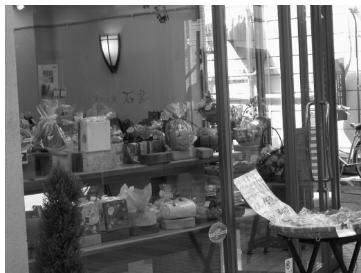
▲菓子工房石黒のショウウィンドー

菓子工房石黒は、「なかのぶスキップロード」の丁度中ほどに位置する洋菓子店。洋菓子店とは言っても、菓子職人の修行から帰ってきた現社長のご子息へ実質的に経営移譲した6年前から現在の店舗となった。