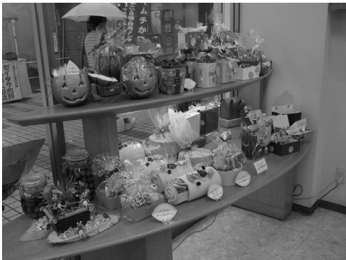
▲飾りつけも凝っている

生菓子だけで常時30種類以上あり、顧客も引きを切らない状況である。こうした商品の素晴らしさは、ご子息を中心とした職人さんの技能の高さとセンスの良さによる。低価格で提供できるのは、販売数量の多さによって可能となっている。