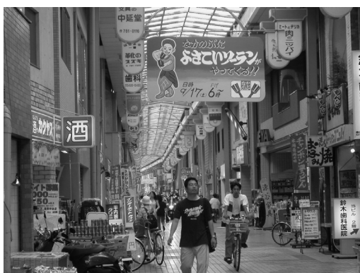
▲なかのぶスキップロードの様子

東京都品川区の中延商店街(なかのぶスキップロード)は東急池上線「荏原中延駅」と東急大井町線「中延駅」を結ぶ通り沿いにあり、周辺は住宅街で最寄品店の多い近隣型商店街である。