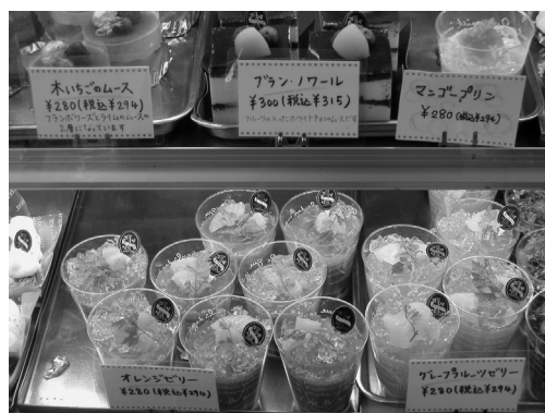
▲見るからにおいしそうなお菓子類