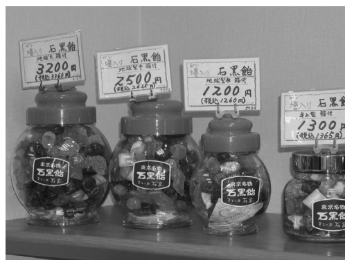
▲店内には石黒飴の販売コーナーがある▲